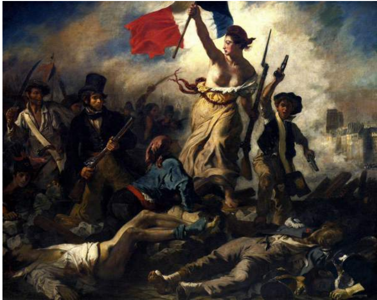
La liberté guidant le peuple - Delacroix

Pour une étude détaillée du tableau de Delacroix :