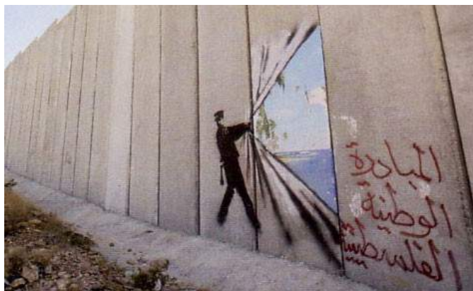
Mur de Palestine - Banksy

Pour découvrir Banksy et d'autres images de ses fresques :